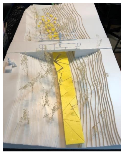
裝置藝術《海的控塑》

「浮游之樂」節目老少皆宜，兼具教育意義。誇啦啦貫徹藝術教育的宗旨，除了以深入淺出的藝術形式說水，更加入互動元素，適合一家大小前來歡度周末。不論年齡，參加者將能穿梭於沙螺灣村不同角落，在互動體驗劇場與角色交流；跟隨可愛的精靈藍藍踏上尋寶之旅，學習水的知識；也可以參與手工藝工作坊、遊戲及導賞團，費用全免。