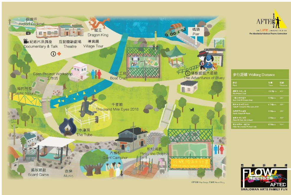
「浮游之樂」藝動沙螺灣節目地圖

更多相關照片： https://drive.google.com/drive/folders/1OPh0a7ePXoBSqUXTQbJbYy2g2QeA88Nd?usp=sharing